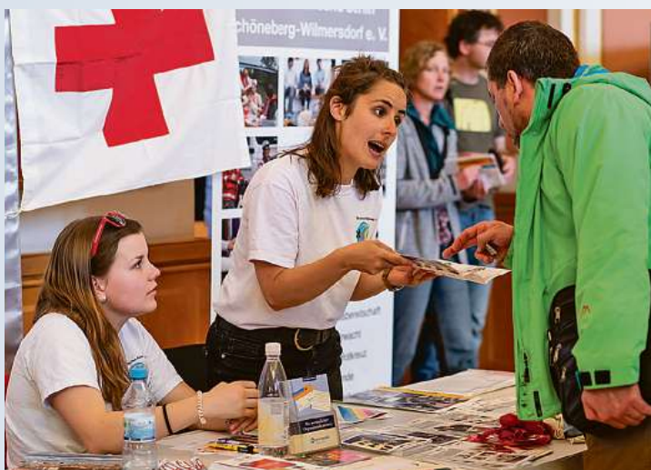
Am 6. Mai stellt sich die Berliner Engagementsszene an insgesamt 120 Infoständen vor. Einige der Teilnehmer finden Sie hier in einem Kurzporträt.

Engagierte Menschen stehen auch auf der 16. Freiwilligenbörse für Informationen, persönliche Beratungen und zum Erfahrungsaustausch bereit. Anfangs an 65 Ständen im Rathaus, ab 13 Uhr mit weiteren 55 Open-Air-Ständen auch draußen beim Börsenfestival zwischen Rathaus und Neptunbrunnen. Schon jetzt stehen alle Angebote online auf berliner-freiwilligenboerse.de – sie bleiben dort das ganze Jahr über. „Aber im direkten Gespräch lassen sich alle Fragen am besten klären,“ weiß Carola Schaaf-Derichs von der Landesfreiwilligenagentur aus langjähriger Erfahrung.